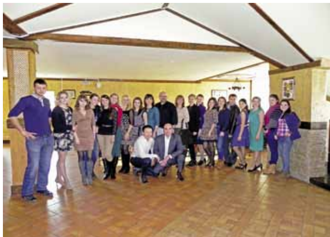
Выпускники баварской практики разных годов собрались вместе в Подмоскowie.

Участники программы, пройдя конкурсный отбор, получают возмож-