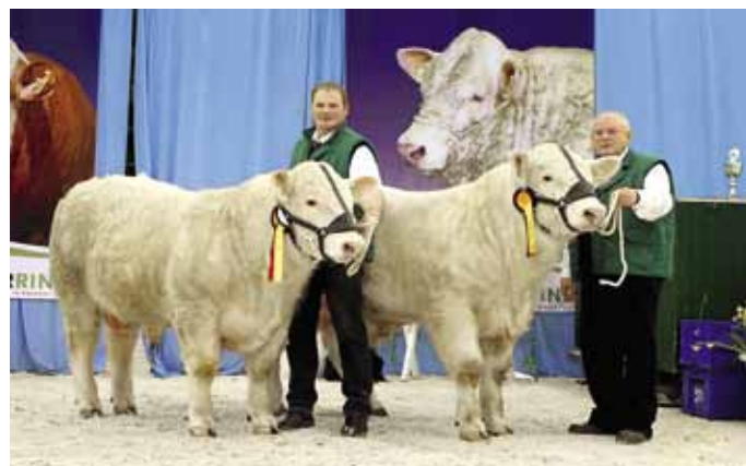
Победители среди шаролеизской породы обошлись новым владельцам в немалую сумму.

Хорошо отлаженная поставка продаваемых животных и свободный отбор племенных производителей приятно порадовали посетителей и закрепили позитивный настрой. Более 800 гостей из всех регионов Германии, а также из-за рубежа прибыли на известную нижнесаксонскую выставку скота. Большое количество посетителей, прекрасное настроение, отменное качество представленных животных способствовали активному проведению аукциона и установлению чрезвычайно высоких цен. Средняя стоимость молодняка ангусской, шаролеизской, белой